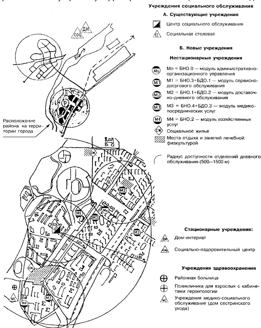
Рисунок 6.2 — Блок-модульный метод размещения учреждений социального обслуживания пожилых людей в сложившемся районе города

Требования к обустройству территорий вблизи специальных жилых домов изложены в [18] .