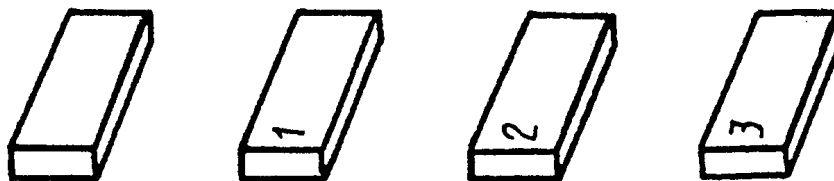
"Рис. 2. Маркировка пиломатериалов (включая брусья) и заготовок мелком на пласти"