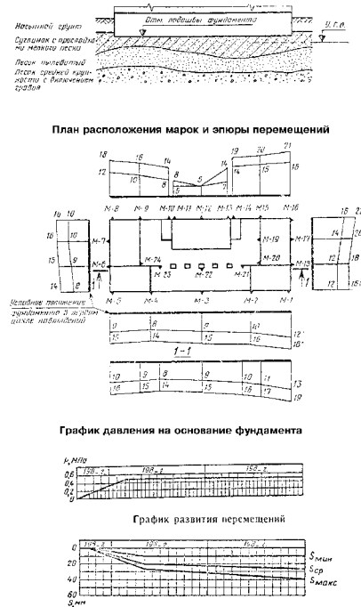
ОБРАЗЕЦ ГРАФИЧЕСКОГО ОФОРМЛЕНИЯ РЕЗУЛЬТАТОВ НАБЛЮДЕНИЙ ЗА ДЕФОРМАЦИЯМИ ОСНОВАНИИ ФУНДАМЕНТОВ