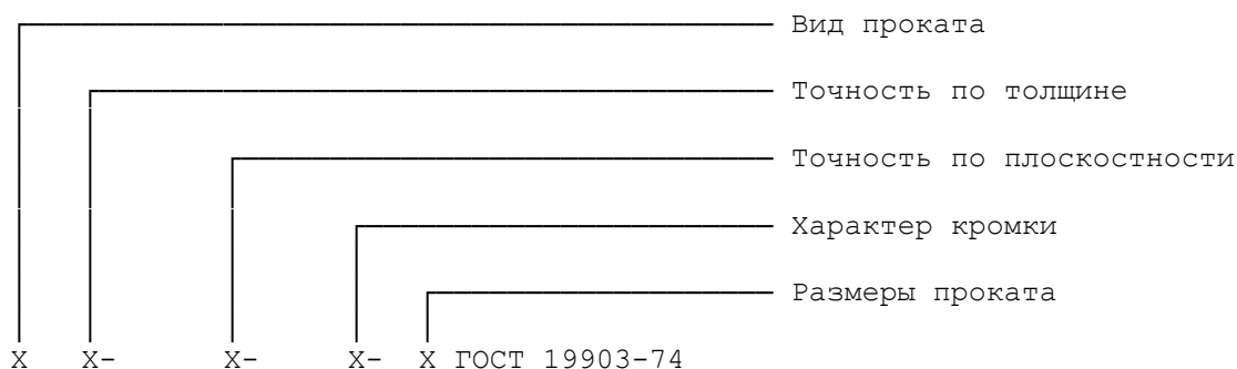
Схема условного обозначения